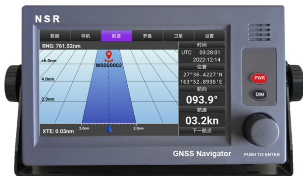
夜晚模式 (航道界面)